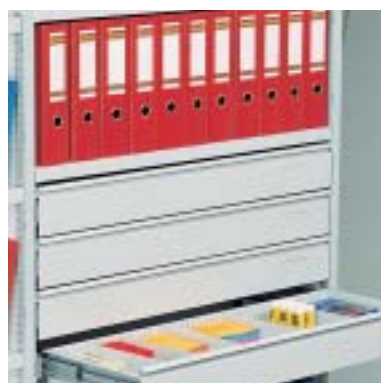
Schubladen für Kleinmaterial