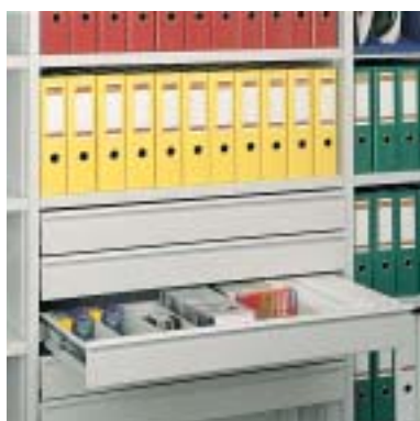
Schublade für Disketten und CD-Roms