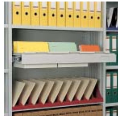
Hängeauszug für Karteikästen; Stehsammler