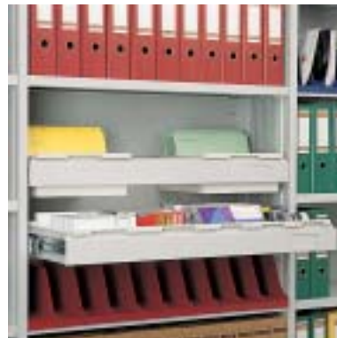
Hängeauszug für Kunststoffkästen zur Aufbewahrung von Disketten, CD-Roms und Videos