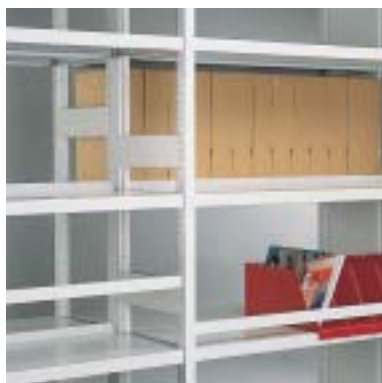
Seitenanschlag, Fachbodenanschlag, Anschlagprofil