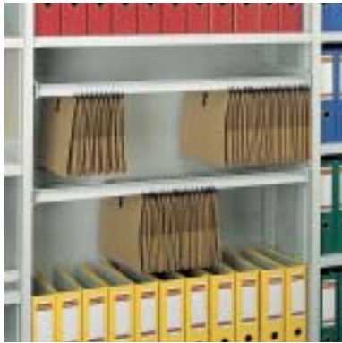
Hängerahmen lateral für DIN A4